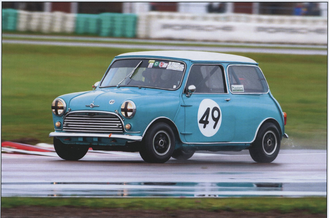
Kevin Bengtsson vann lätt bägge racen för äldre standard med sin Cooper S.