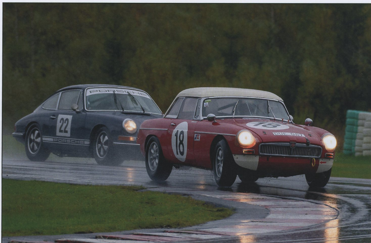
Jimmy Edwardsson i M.G. MGB hade en intensiv uppgörelse med Lars Weigl i GT '65 racet.