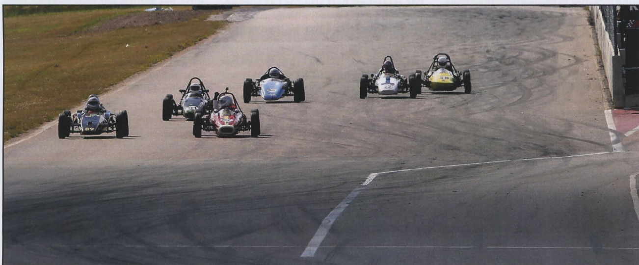
Tät målgång i det första Formel Vee-heatet. Fyra bilar inom 1,5 sekund.

Kinneulle och Karlskoga fick flytta fram sina evenemang och Svenskt Sportvagnsmeeting på Knutstorp tvingades ställa in, varför Mantorp blev den första tävlingen i serien mot "normalt" den fjärde.