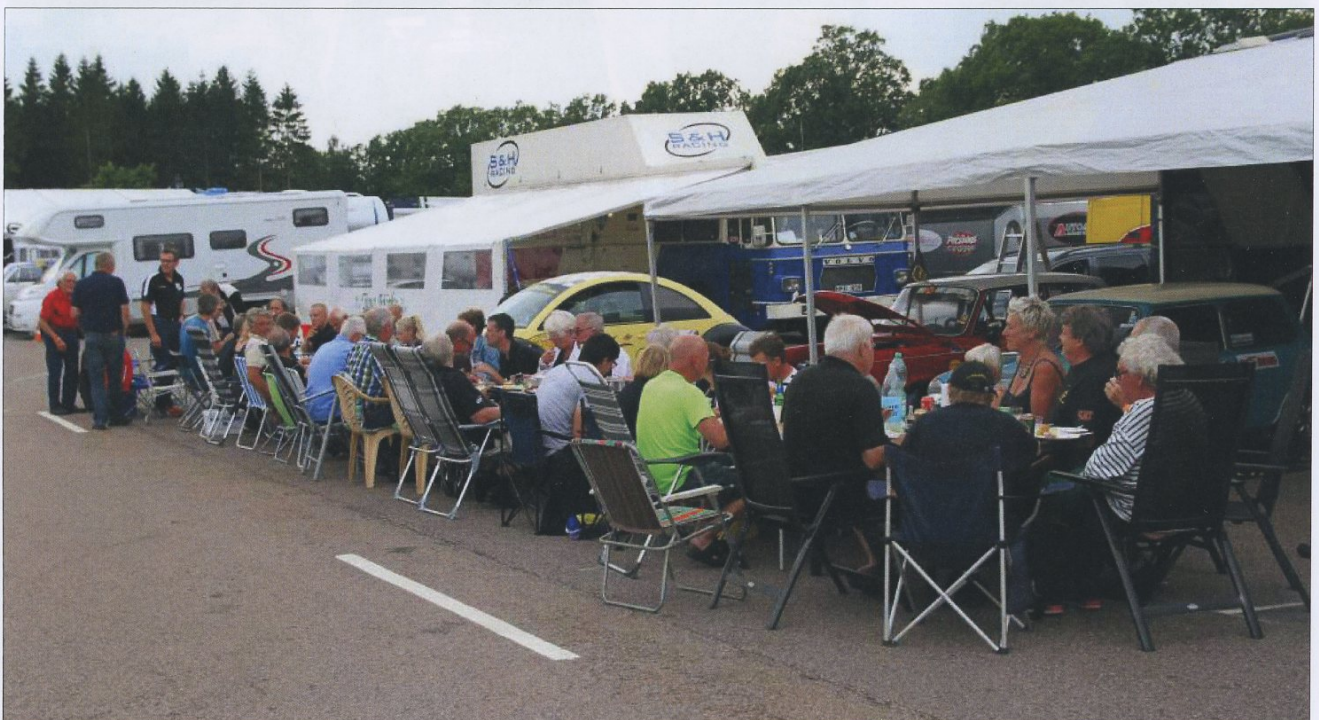
1000 cc Cupen hade långbord vid Svenskt Sportvagnsmeeting.