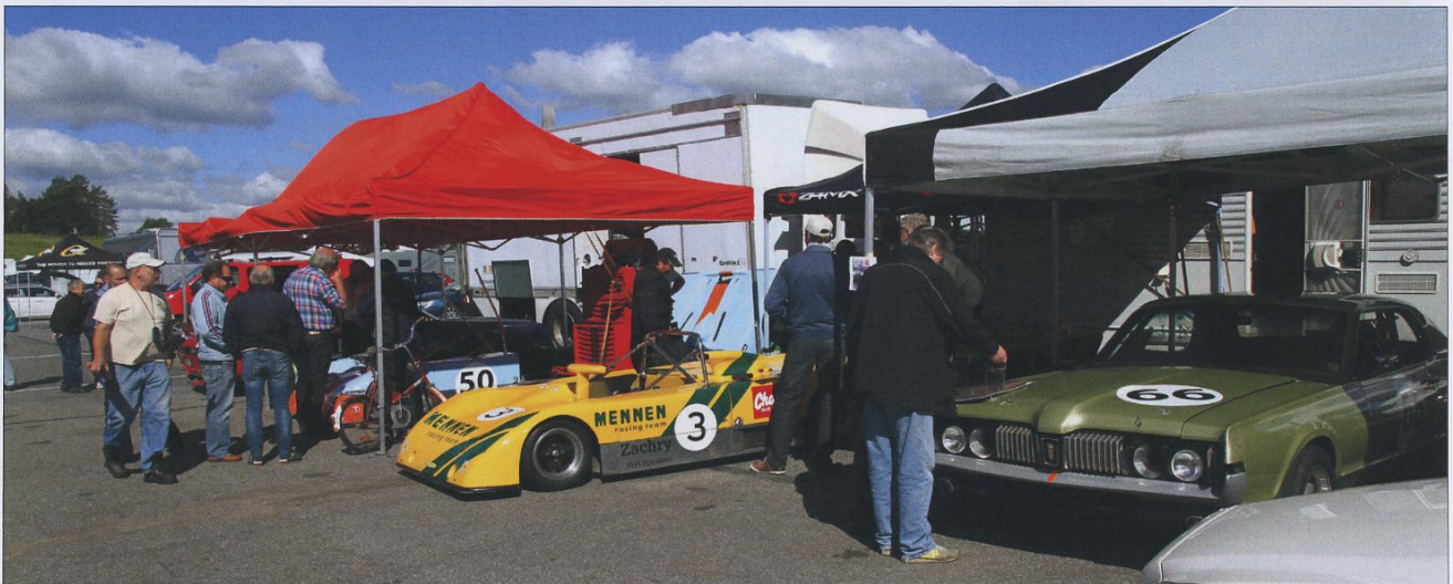
Depåliv på Gelleråsen.