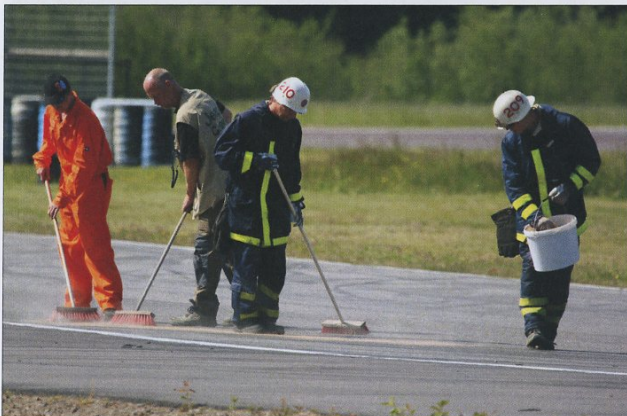
Tänk litet extra på våra vänner funktionärerna som ofta får städa upp efter oss. Inga funktionärer – ingen tävling.