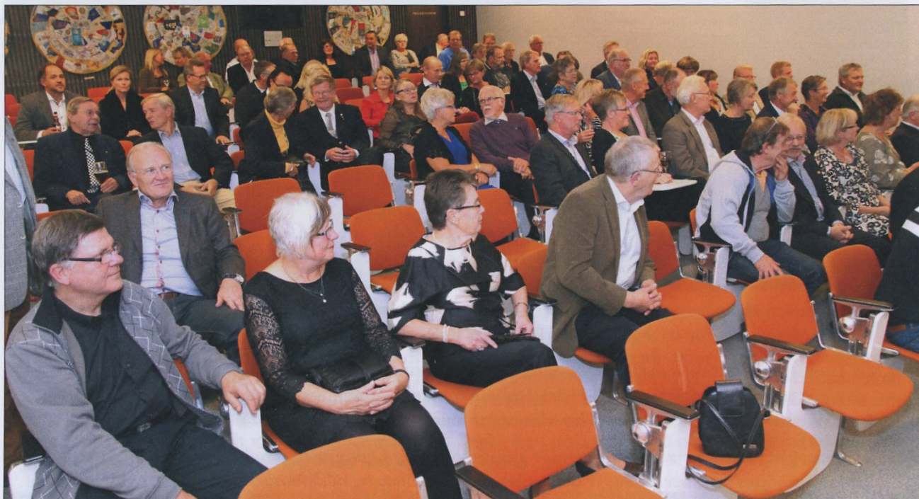
Förväntansfull väntan inför prisutdelningen.